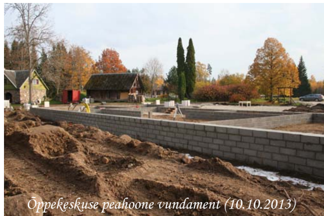
Õppekeskuse peahoone vundament (10.10.2013)