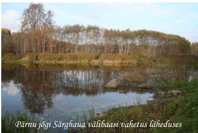
Pärnu jõgi Särghaua välibaasi vahetus läheduses

15.–17. augustil 2014 TTÜ Geoloogia Instituudi Särghaua välibaasis Pärnumaal Vändra vallas Kurgja külas