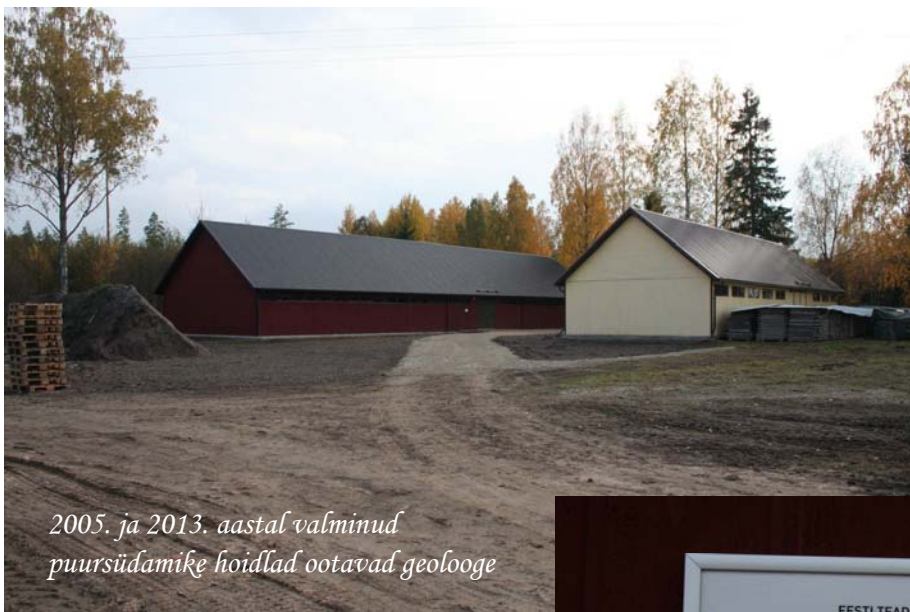
2005. ja 2013. aastal valminud puursüdamiķe hoidlad ootavad geolooge

15.–17. augustil 2014 TTÜ Geoloogia Instituudi Särghaua välibaasis Pärnumaal Vändra vallas Kurgja külas