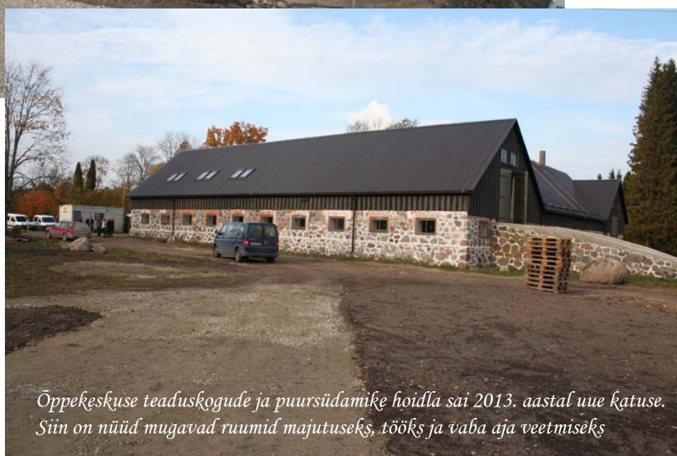
Õppekeskuse teaduskogude ja puursüdamike hoidla sai 2013. aastal uue katuse. Siin on nüüd mugavad ruumid majutuseks, tööks ja vaba aja veetmiseks