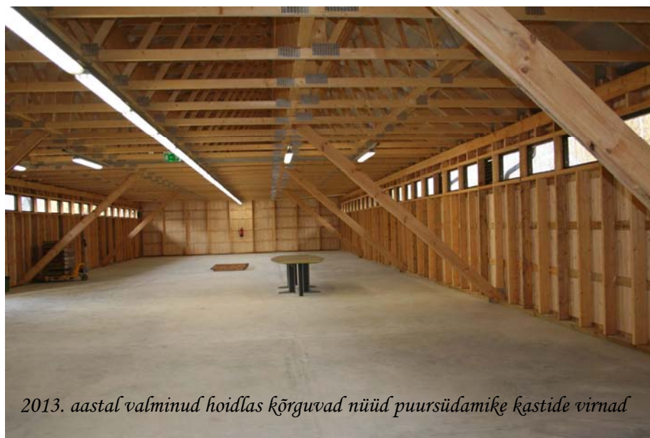
2013. aastal valminud hoidlas kõrguvad nüüd puursüdamiķe ķastide virmad

TULE JA TUTVU SÄRGHAUA VÄLIBAASI ÕPPEKESKUSE VÕIMALUSTEGA!