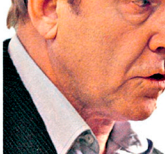
Esimese fosforiidisõja sangar on ka praeguses võitluses eplikelt pildile saanud.

"Mina kui kontserni juhataja pean mõtlema, mis saab 10, 15, 20 aastat pärast," jutustab Eesti